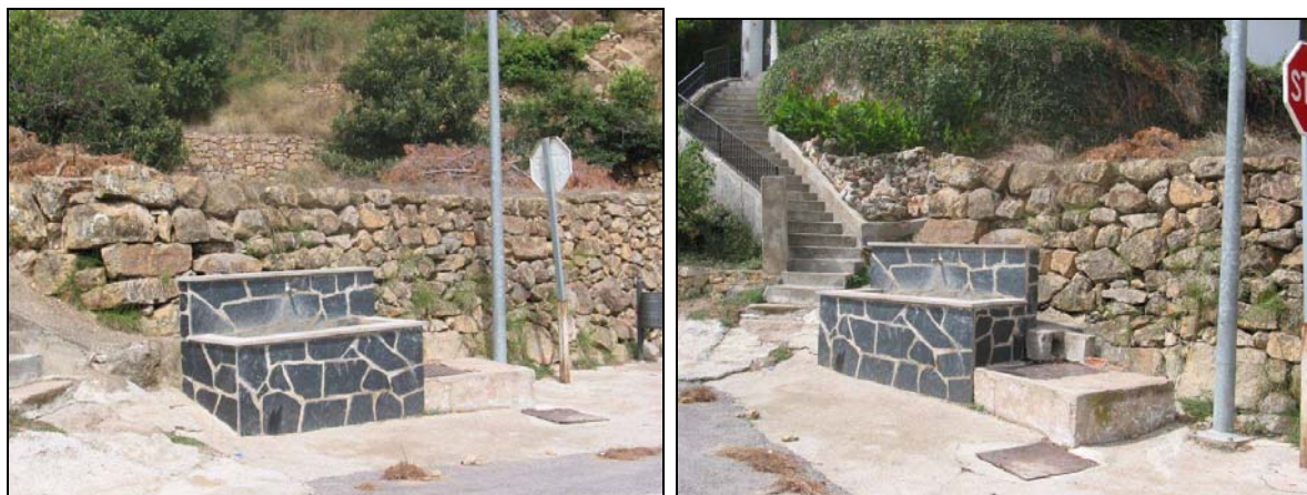
Fotografias 23 y 24: Fuente Azul