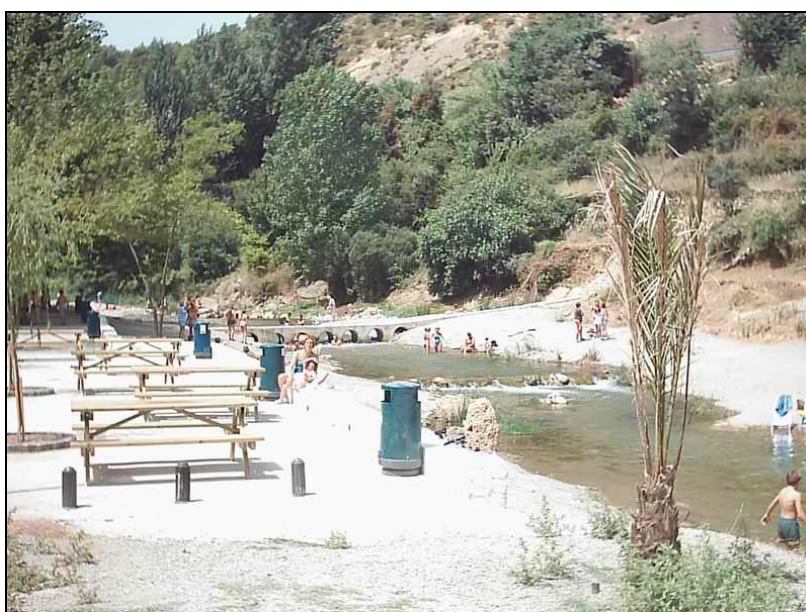
Fotografía 5: Paraje del Batán