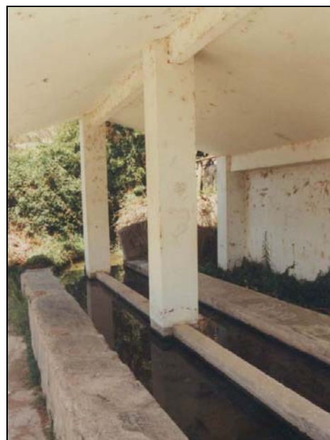
Fotografias 11 y 12: Lavadero de Teresa