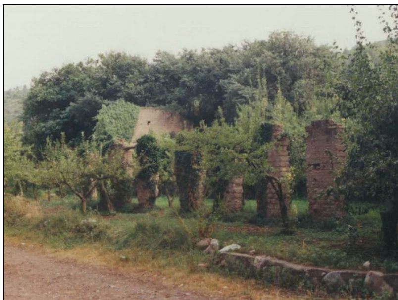
Fotografia 13: Paraje Fuente del Rio