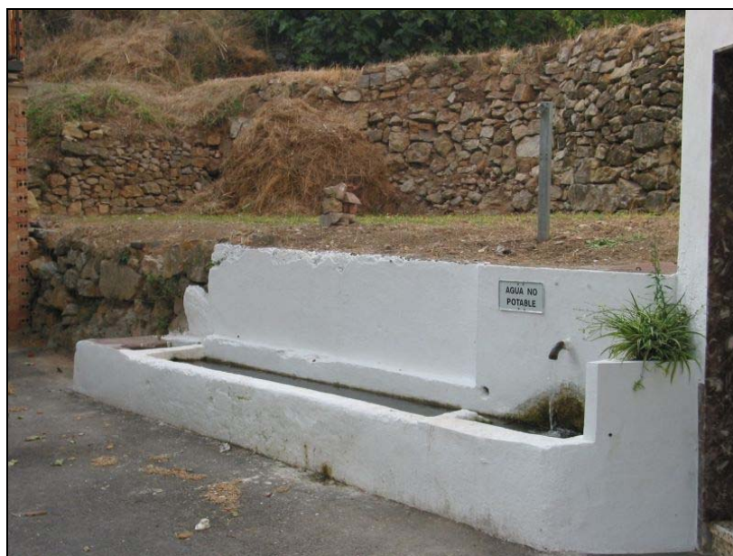
Fotografias 17 y 18: Fuente del Santo