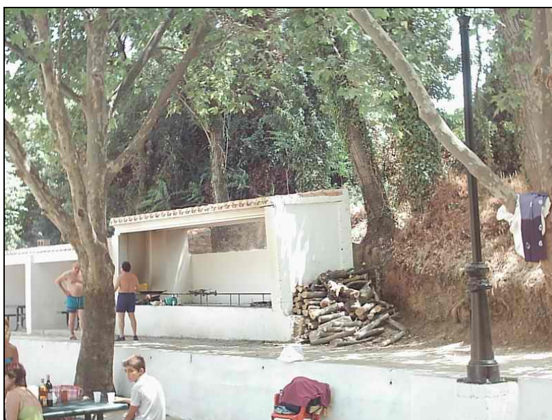
Fotografía 4: Merenderos Paraje del Batán (La Playa)