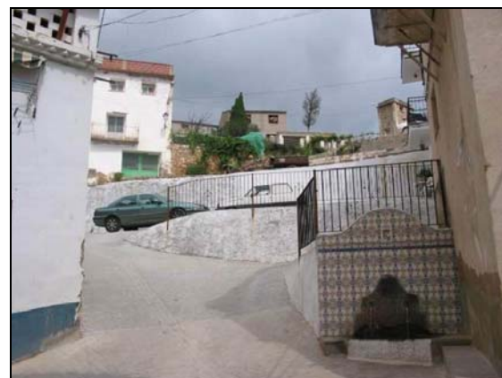
Fotografias 15 y 16: Fuente del Calvario