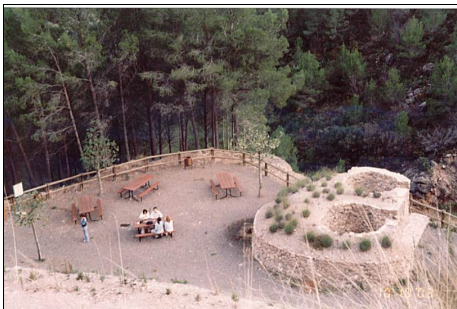
Fotografía 10: Paraje de los Hornos