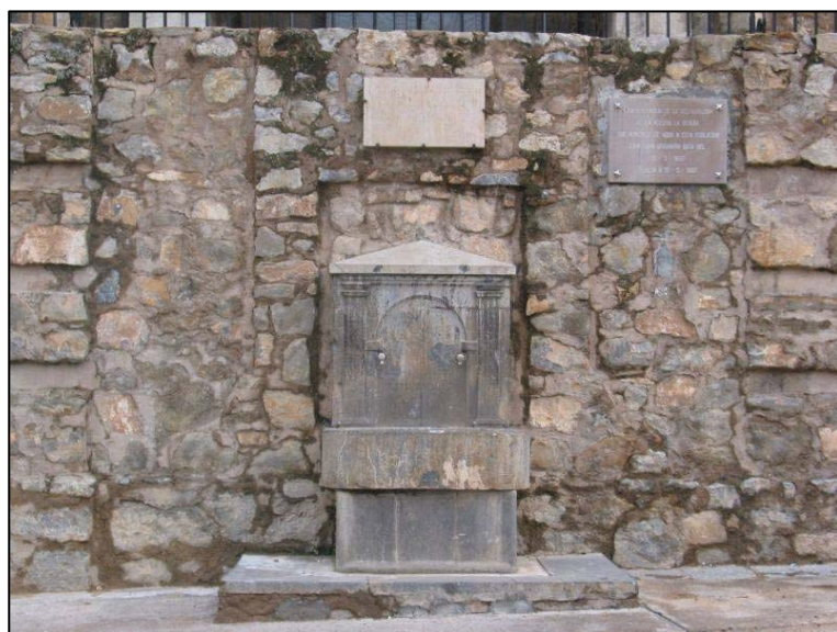
Fotografía 21 y 22: Fuente de la Plaza