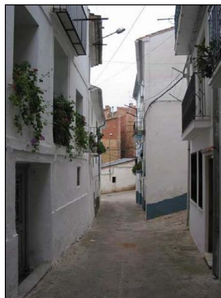
Fotografía 28, 29 y 30: Calles del casco urbano de Teresa