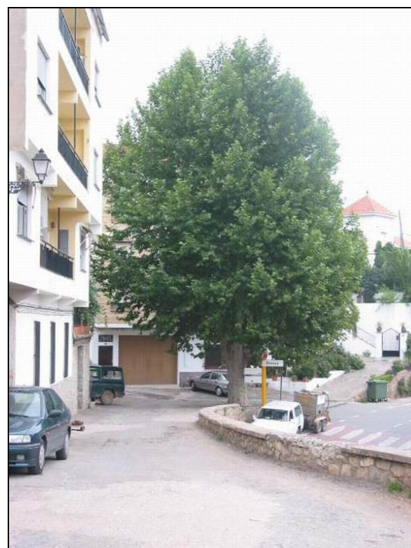
Fotografía 27: Casco urbano de Teresa