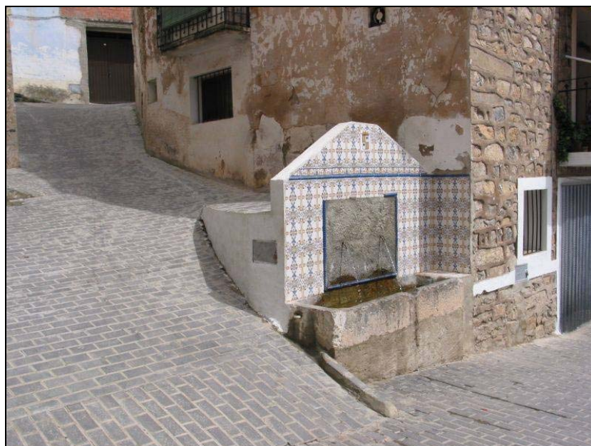
Fotografía 20: Fuente de la Replaceta