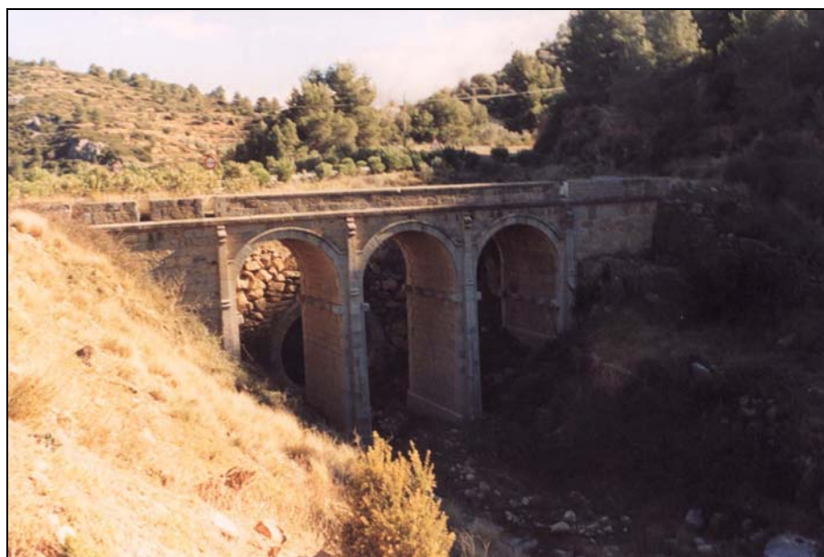
Fotografía 7: Puente del Regajo