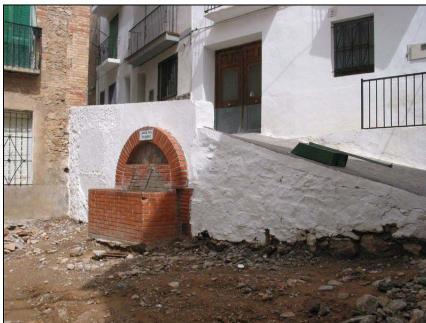
Fotografia 19: Fuente Roja