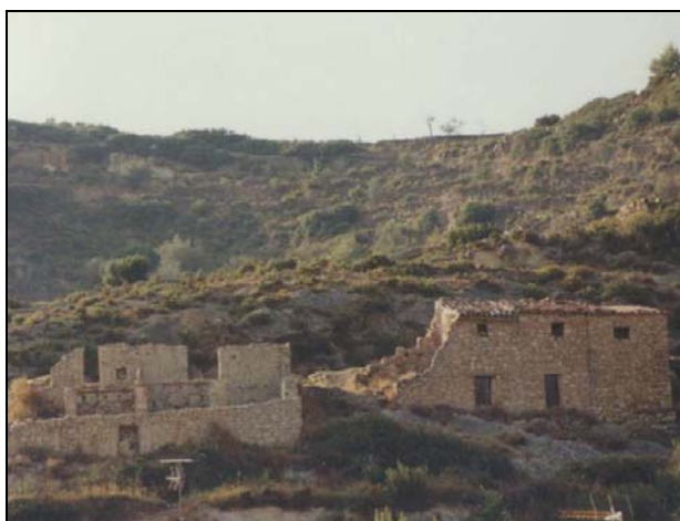
Fotografías 8 y 9: Pajares