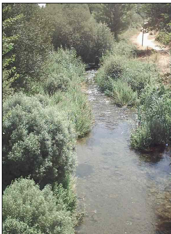
Fotografia 3: Río Palancia