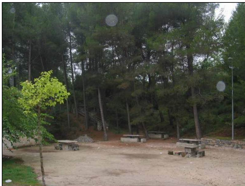
Fotografía 26: Merendero