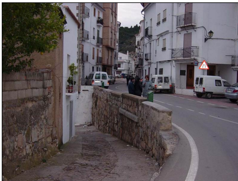
Fotografía 6: Casco urbano de Teresa