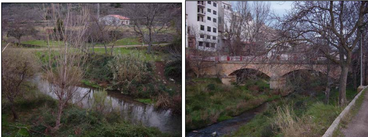
Fotografias 1 y 2: Rio Palancia por su paso por Teresa