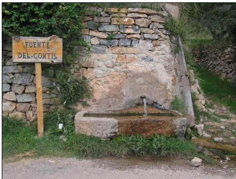
Fotografía 14: Fuente del Contis