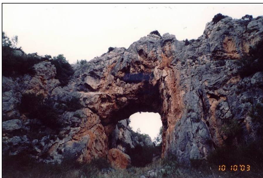
Fotografia 25: El Arco